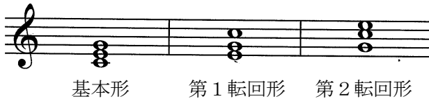
基本形 第1転回形 第2転回形